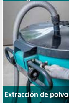
Extracción de polvo ·