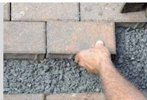
• Mortero de drenaje •