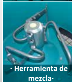
· Herramienta de mezcla ·