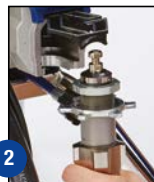
2 Abra la puerta y retire la bomba