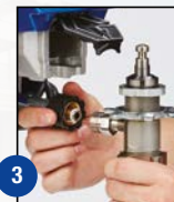
3 Retire la manguera y el tubo de aspiración