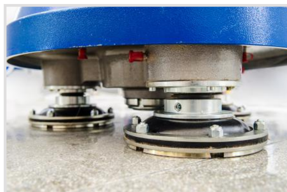
I satelliti porta utensili con nuovi giunti flessibili anti-shock aumentano stabilità e maneggevolezza.