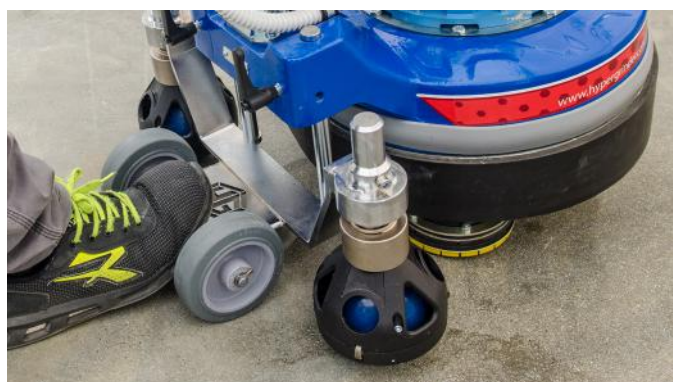
Nuove ruote di lavoro a sfera ammortizzate. Sollevabili e regolabili in altezza.