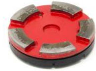
HG-M utensili diamantati per cementi medio abrasivi.