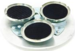
SPRING HOLD SYSTEM per una lucidatura del cemento perfetta e omogenea.