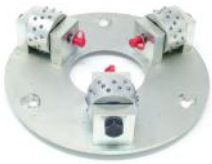
BUSH HAMMER utensile esclusivo utile per molte applicazioni.