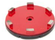
SERIE GM Dischi diamantati metallici per levigare granito e gres.