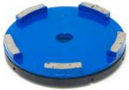
HG-H utensili diamantati per la molatura di pavimenti DURI.