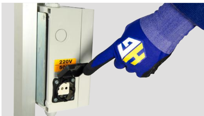
Presca 220V supplementare a bordo posta sul retro dell'asta manico.