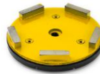
TCK SERIES preparazione e rimozione di rivestimenti su pavimenti in cemento.