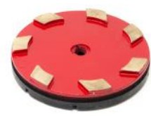
SERIE MM dischi diamantati metallici per la levigatura del marmo.