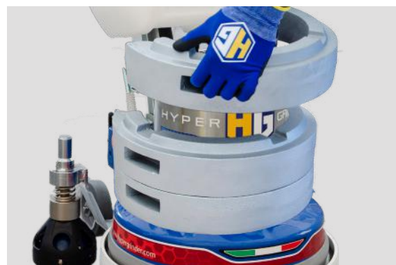
Pesi dedicati in ghisa, per levigare e lucidare anche le pietre più dure. (17 Kg cad.)