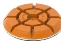
JUMPY ORANGE per lucidare Graniglia, Terrazzo, Limestone e Seminati.