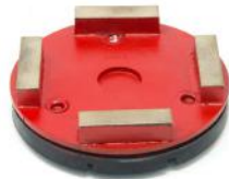
HG-S utensili diamantati per cemento morbido.