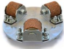
SANDBLASTING per effetto sabbatura.