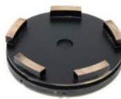
SERIE MTM per levigare terrazzo, agglomerato, limestone, travertino e pavimenti abrasivi.