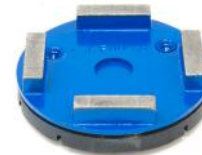
HG-A utensili diamantati per cementi molto abrasivi e asfalto.