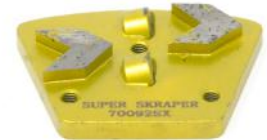
PDC HYPER SCRAPER per rimozione resine e rivestimenti a spessore.