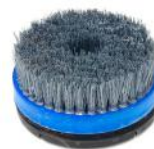
ANTIQUE BRUSH sistema per anticare marmo, pietra e cotto.