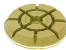
JUMPY GREEN per levigare e lucidare pavimenti in cemento.