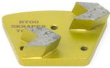
TCK ARROW per rimozione di resine e vernici su pavimenti in cemento duro.