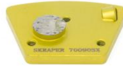
PDC SCRAPER per rimozione resine e rivestimenti a spessore.