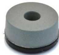
PAVELUX per rimuovere mastice o levigare marmo e granito.