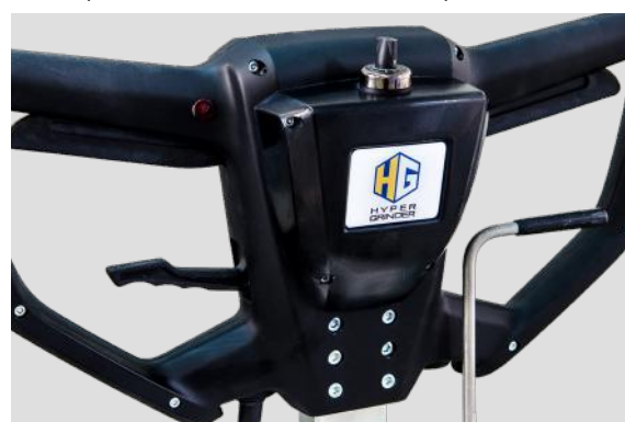
Variatore di velocità per massimizzare le performance in ogni situazione.