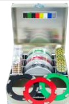
TOOLS BOX Kit per levigatura e lucidatura con trolley in acciaio.