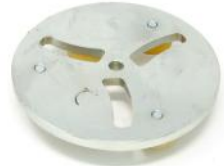
READY COOL piatto per utensili trapezoidi Quick lock.