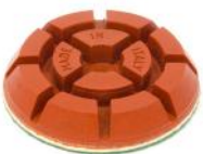
JUMPY RED dischi diamantati resinoidi per lucidare granito e gres.