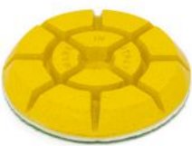
JUMPY YELLOW dischi resinoidi per lucidare pavimenti in marmo.