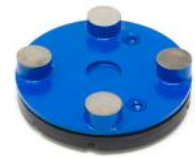
BT ROUND per rimozione di resine e vernici a basso spessore.